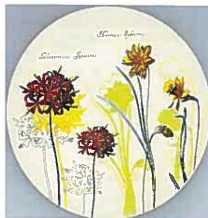
Plat à gâteau - 55€

Devant le succès remporté par cette collection florale, et à l'occasion de l'exposition « L'herbier du Roy » présentée du 22 octobre 2008 au 19 janvier 2009 au Cabinet d'histoire du Jardin des Plantes à Paris, la Rmn a invité Gien à prolonger cette expérience de 4 nouveautés en faïence : 1 plat à gâteau, 1 coffret de 4 assiettes assorties, 1 coupelle carrée grand format et 1 coffret de 2 coupelles carrées petit-format.