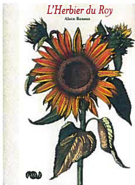
L'Herbier du Roy Auteur : Alain Renaux

..... Louis XIV aimait rendre visite à son jardin fruitier et potager. Enrichi de plantes exotiques ou d'espèces plus communes au fil des expéditions botaniques qui se multipliaient au XVII e siècle, le jardin du roi, véritable laboratoire agronomique, faisait l'admiration des cours européennes et fournissait des modèles végétaux aux académiciens, dessinateurs et graveurs.