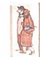
18. Casagemas y Picasso