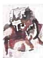
06. Trois femmes