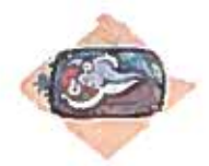
09. Nu couché