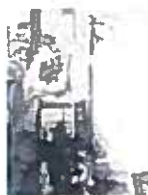
07. Sculpteur et modèle