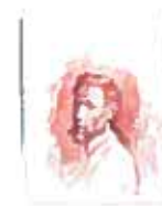
17. Retrato del padre