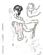
01. Artiste dessinant

Libres de droit uniquement pendant la durée de l'exposition