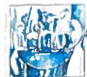
04. Carnaval au bistro