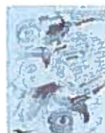
10. Tête de femme