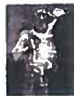
11. L'homme au mouton