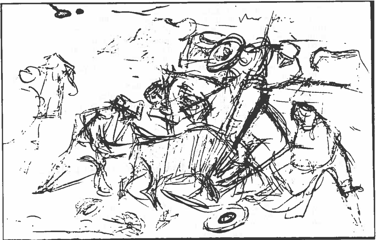
SCENE DE CORRIDA [1897-1898] PLUME, ENCRE BRUNE ET CRAYONS DE COULEUR PARIS, MUSEE PICASSO