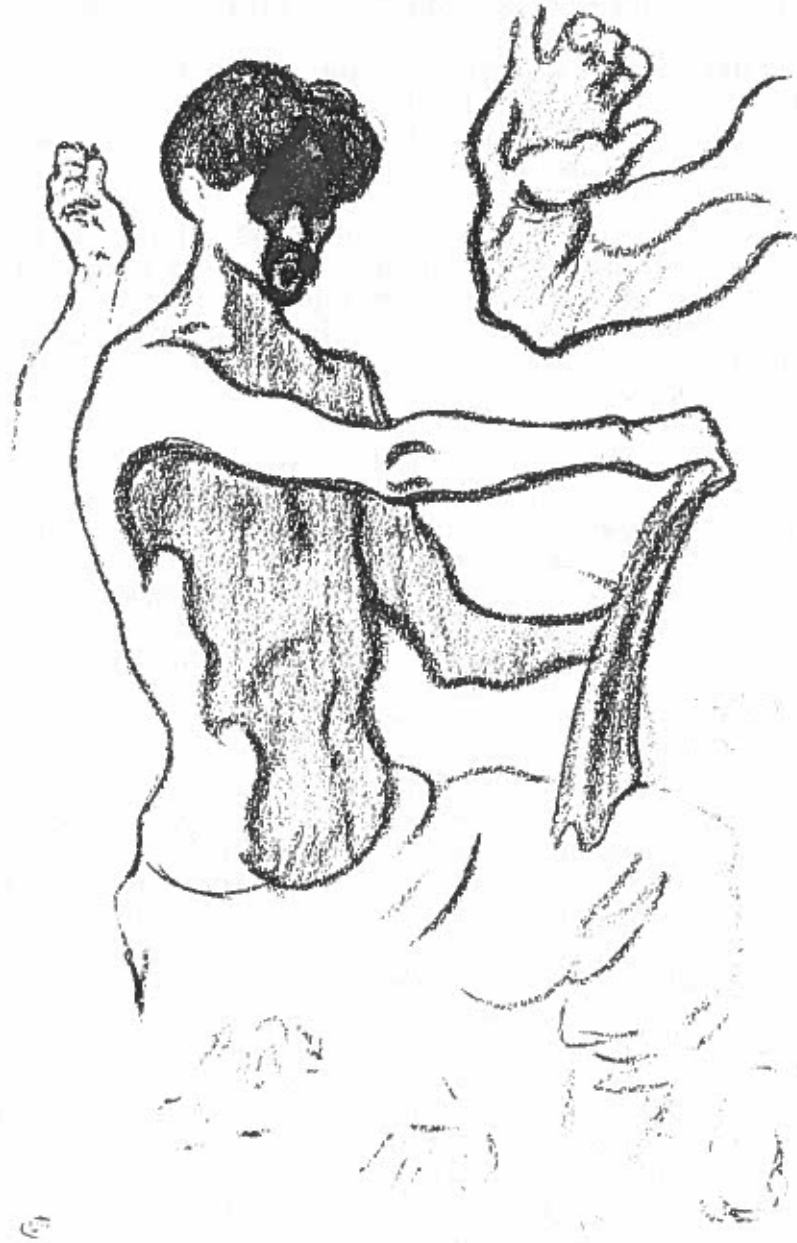
L'ARTISTE DESSINANT ET ETUDES DE MAINS [1898-1899], HORTA DE ERRO FUSAIN PARIS, MUSEE PICASSO