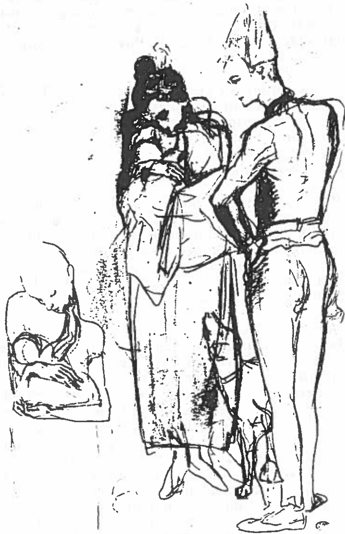
FAMILLE DE SALTIMBANQUES 1905, PARIS MINE DE PLOMB, CRAYON NOIR ET REHAUTS DE CRAYON BRUN PARIS, MUSEE PICASSO